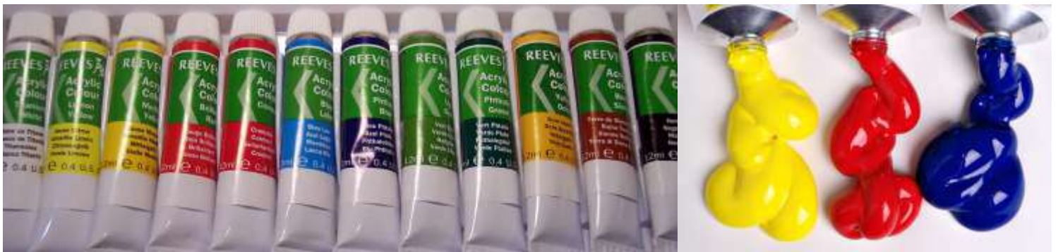
Tintas Acrílicas Importadas: Ótima opção para quem quer investir em um material de qualidade.

Você pode pintar em um pedaço de madeira ou em uma tela. Escolha qualquer meio no qual a tinta acrílica vai aderir com facilidade, pode ser aplicada inclusive, diretamente na parede.