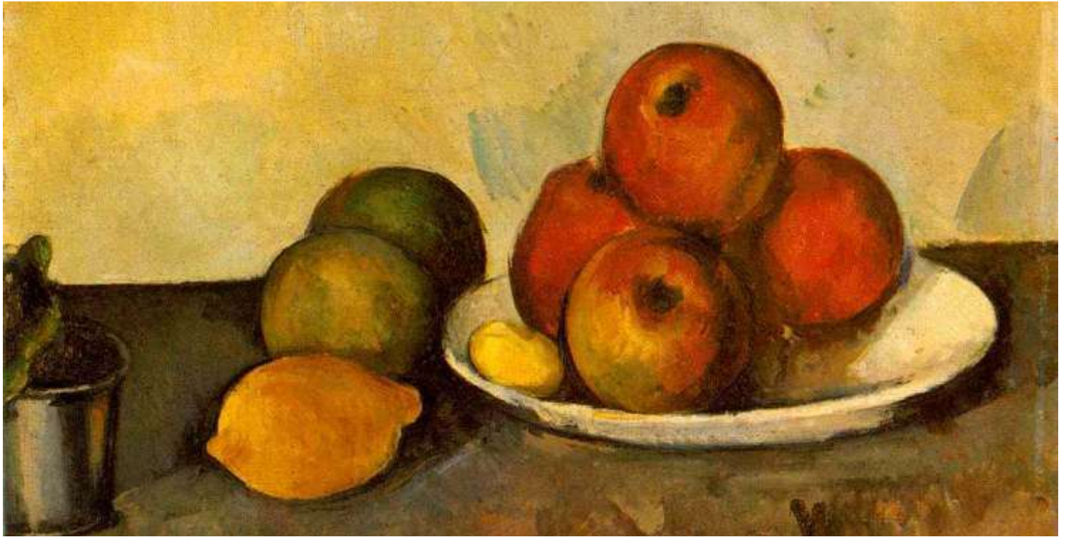
Cezanne - Natureza Morta com Maçãs

Matas e florestas, cerrado, montanhas e desertos, rios e lagos, o mar, cachoeiras... Há tantas razões para pintar ao ar livre, na beleza da natureza; para encontrar paisagens e temas inspiradores e desafiadores; para passar o tempo em lugares tranquilos; capturar a alegria dos pássaros... a graça de uma arara vermelha; saber mais sobre o seu meio ambiente e aperfeiçoar a sua habilidade.