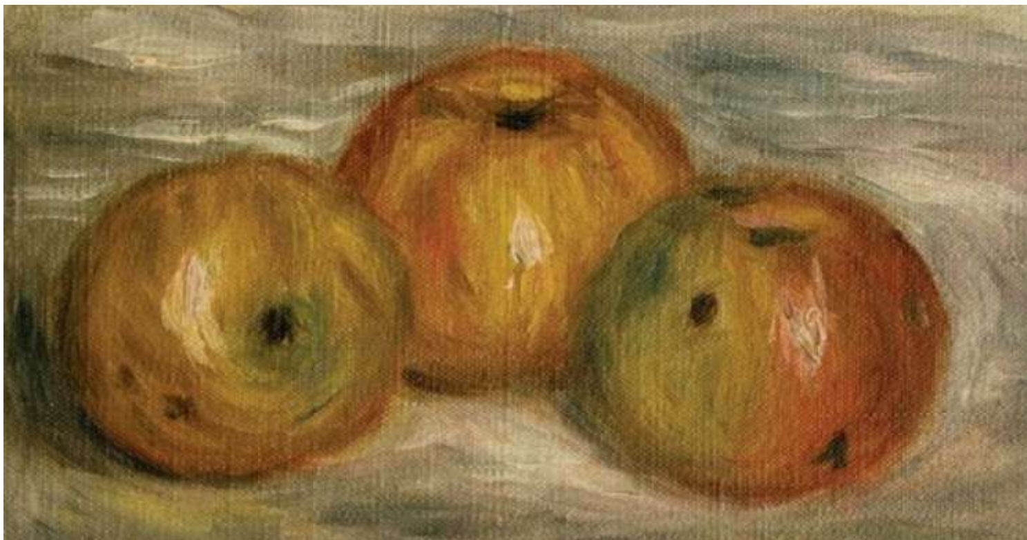
Renoir - Pinceladas Impressionistas

Demora pelos menos três dias para que uma camada seque o suficiente para adicionar uma segunda demão, por isso seja paciente enquanto você espera a sua pintura secar.