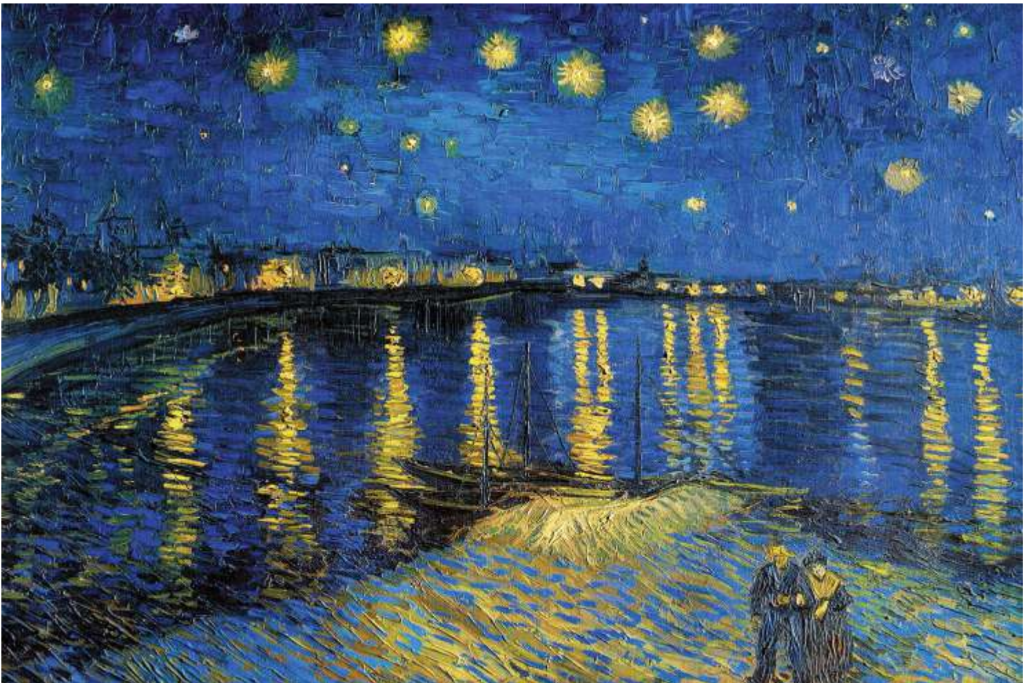
Van Gogh - Starry Night Over The Rhone

E finalmente, tente expor sua obra em local de boa circulação de pessoas.