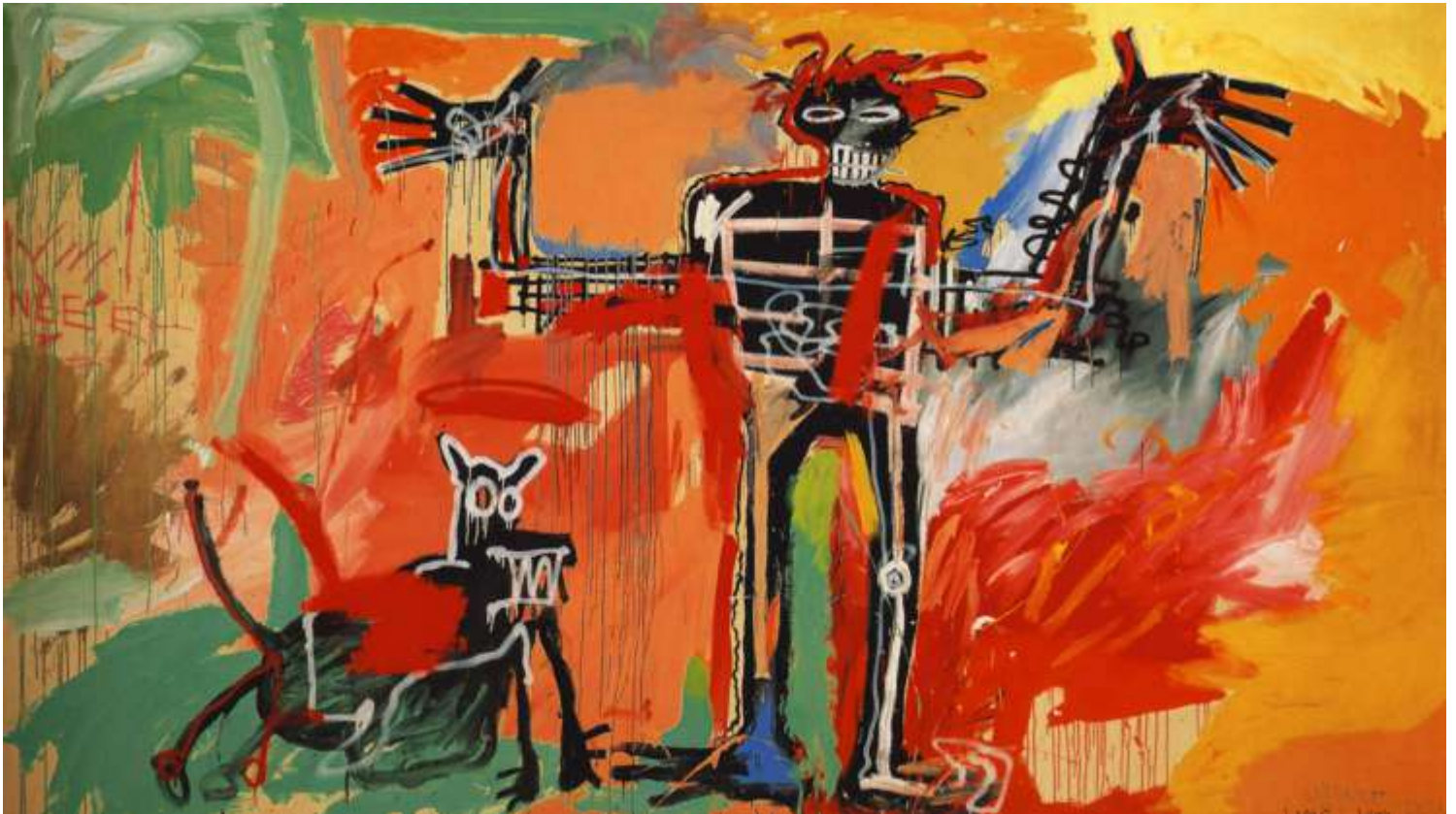
Jean-Michel Basquiat - Boy and dog in a Johnnyump

Pode ser aplicada grossa - ou diretamente do tubo ou com muito pouca água adicionada, ou ainda misturada com um pouco de branco de titânio, dessa maneira, todas as cores das tintas acrílicas são opacas. Se diluídas, elas podem ser usadas como aquarelas ou para aerografia. Existe ainda no mercado um gel médium que deixa a tinta mais cremosa e transparente. Manipular a opacidade, adicionando mais água. Quanto mais água adicionada, mais transparente a tinta ficará.